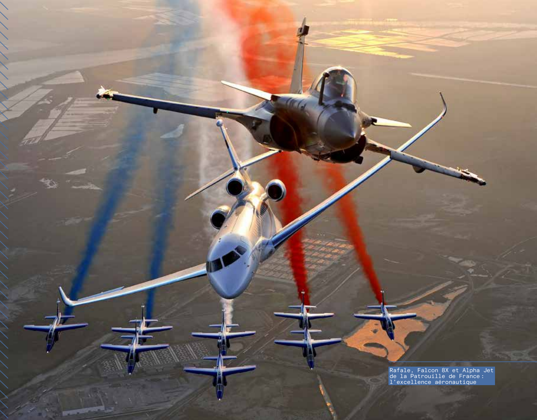
Rafale, Falcon 8X et Alpha Jet de la Patrouille de France : l'excellence aéronautique