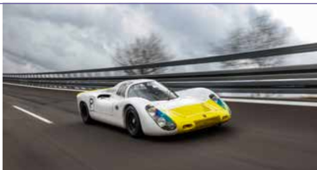
PORSCHE 907 USINE Vendue 4 390 400 € au salon Rétromobile

— Depuis l'acquisition de John Taylor en 2017, l'un des grands acteurs internationaux de l'immobilier de luxe, le Groupe Artcurial développe sa position internationale dans l'intermédiation de biens d'exception autour d'une grande spécialisation et d'une compétence reconnue dans chaque domaine d'expertise. Le Groupe est aujourd'hui à même d'apporter à une clientèle mondialisée les meilleurs services et conseils dans les nombreux domaines des biens d'exception.