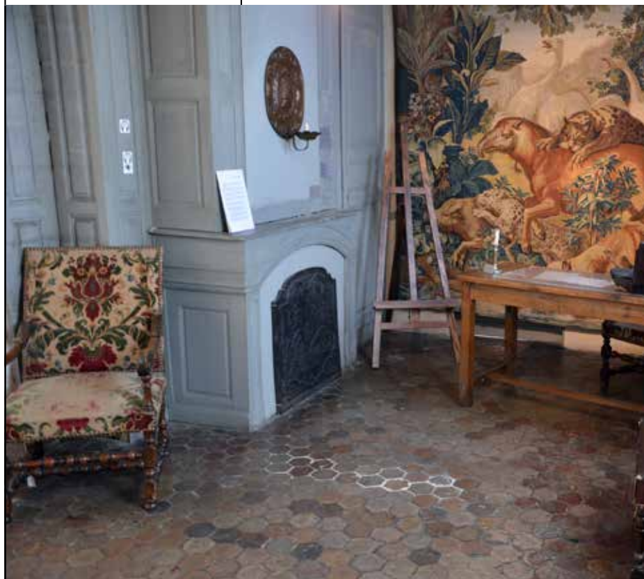
Le musée Jean de la Fontaine

— Parmi eux, le Palais du Tau à Reims (Champagne-Ardenne), les Maisons de Charles de Gaulle à Lille (Nord) et de Jean de La Fontaine à Château-Thierry (Aisne),