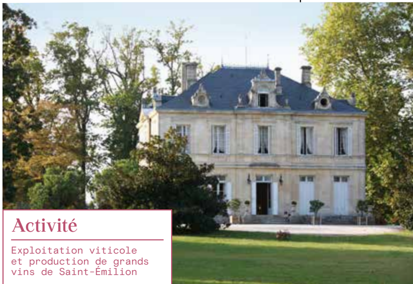
Le Château Dassault