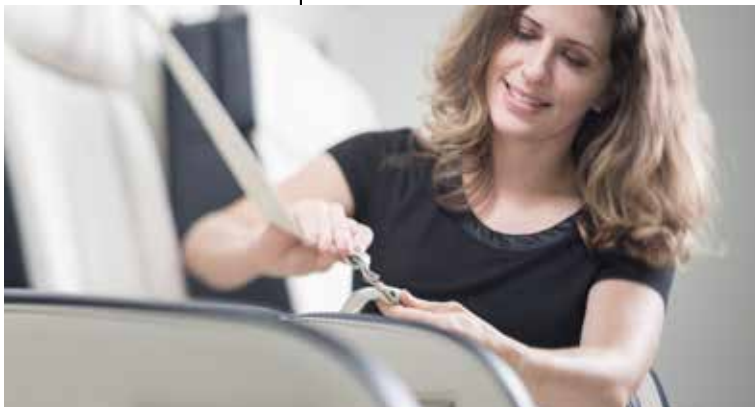
Finition de sièges Falcon à Little Rock

— Le siège de DFJ est situé à Teterboro, sur le premier aéroport d'aviation d'affaires américain, à proximité immédiate de New York.