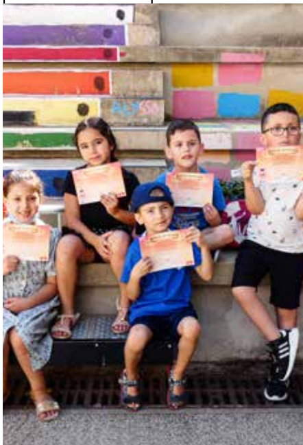
Agir pour l'École