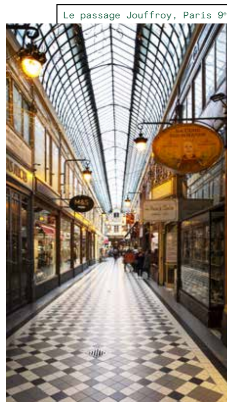
Le passage Jouffroy, Paris 9°

— Au 31 décembre 2022, le patrimoine détenu et géré par L'Immobilière Dassault est composé de 14 actifs immobiliers d'une valeur totale de 873,6 millions d'euros hors droits.