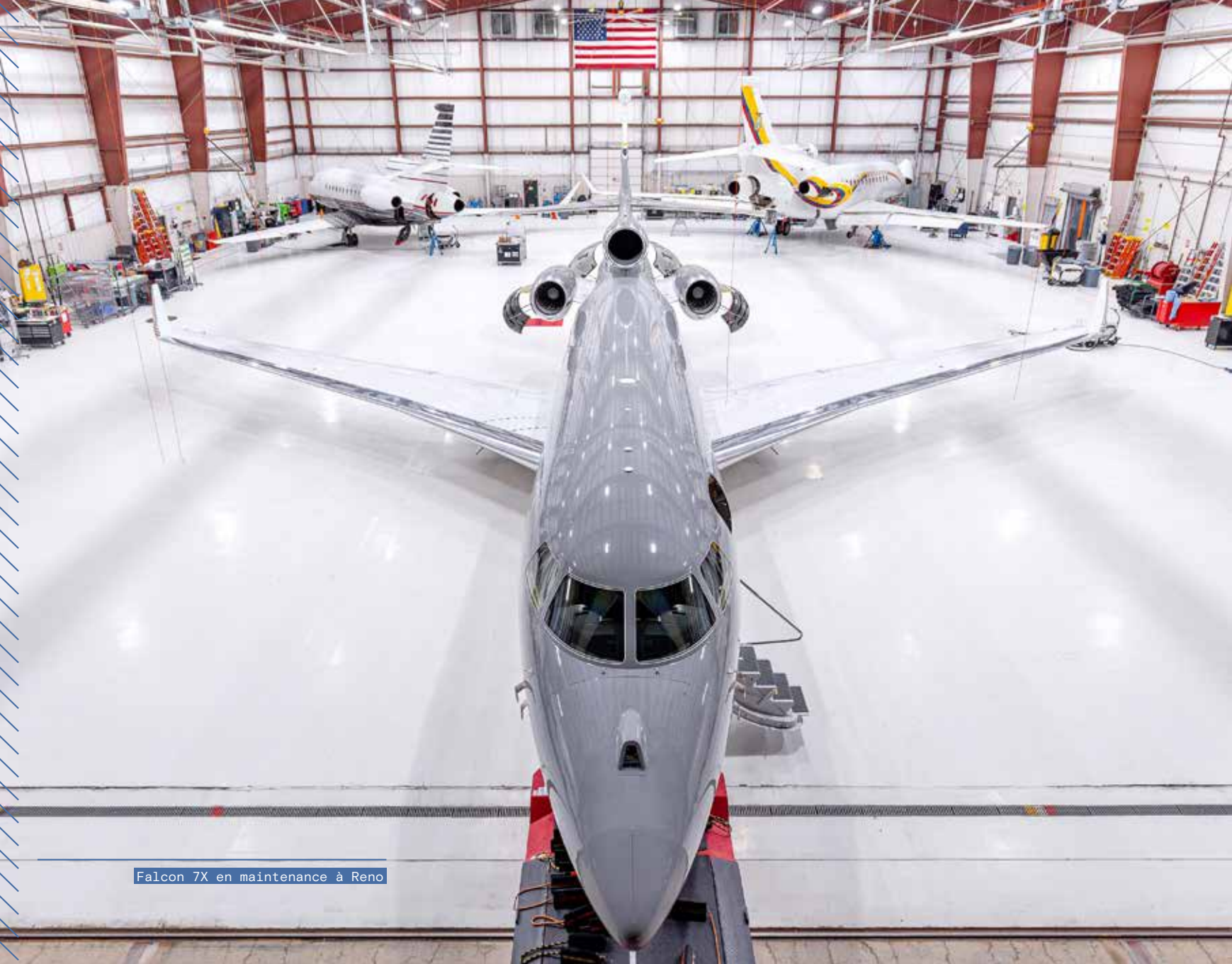
Falcon 7X en maintenance à Reno