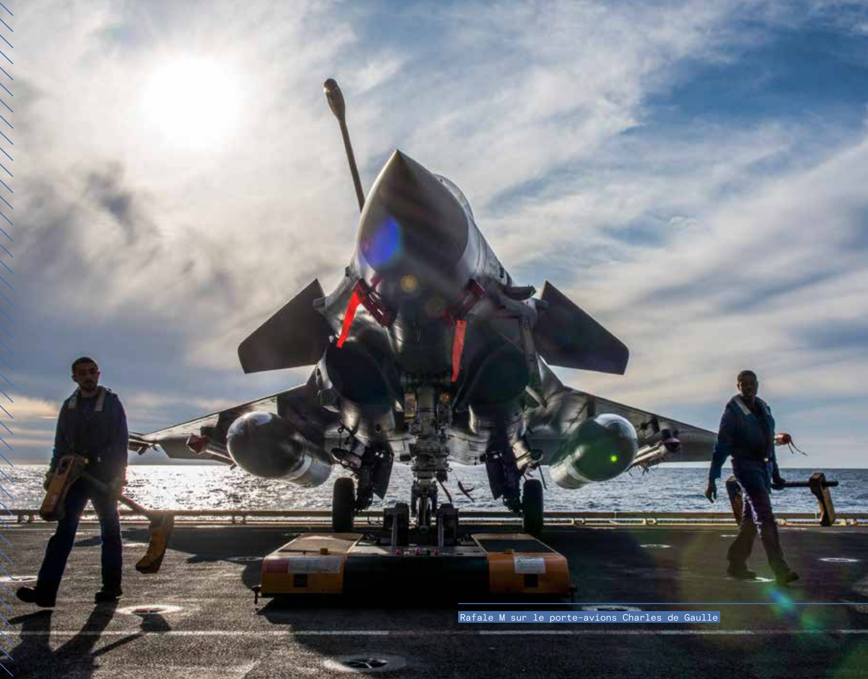
Rafale M sur le porte-avions Charles de Gaulle