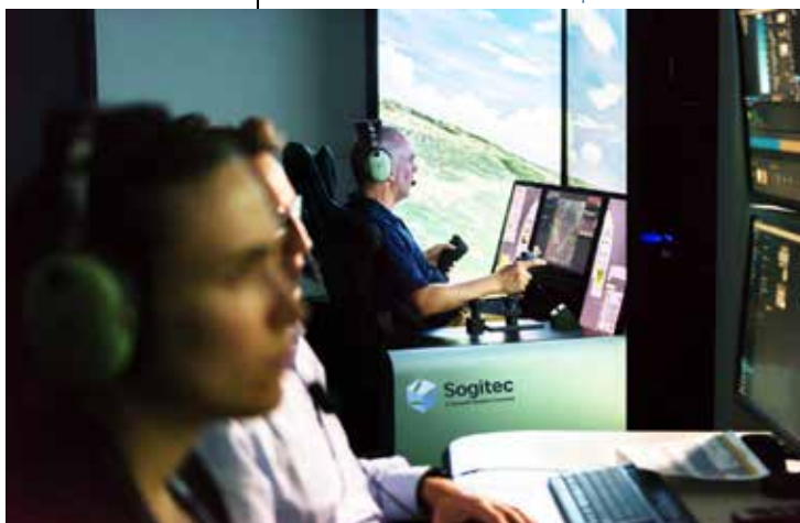
Simulateur Rafale et son poste instructeur

— L'empreinte de Sogitec est mondiale : maîtrise d'œuvre des centres de simulation et simulateurs de vol des équipages Rafale (France, Égypte, Inde, Qatar, Grèce, Croatie) et Mirage 2000 (France, Émirats arabes unis, Grèce, Pérou, Qatar, Taïwan) ; simulateurs de vol des équipages NH90 Caïman (France, Finlande), Puma/ Cougar, Dauphin et de l'Hélicoptère Interarmées Léger (HIL H160M Guépard) ; simulateurs de formation et d'entraînement du personnel de maintenance.