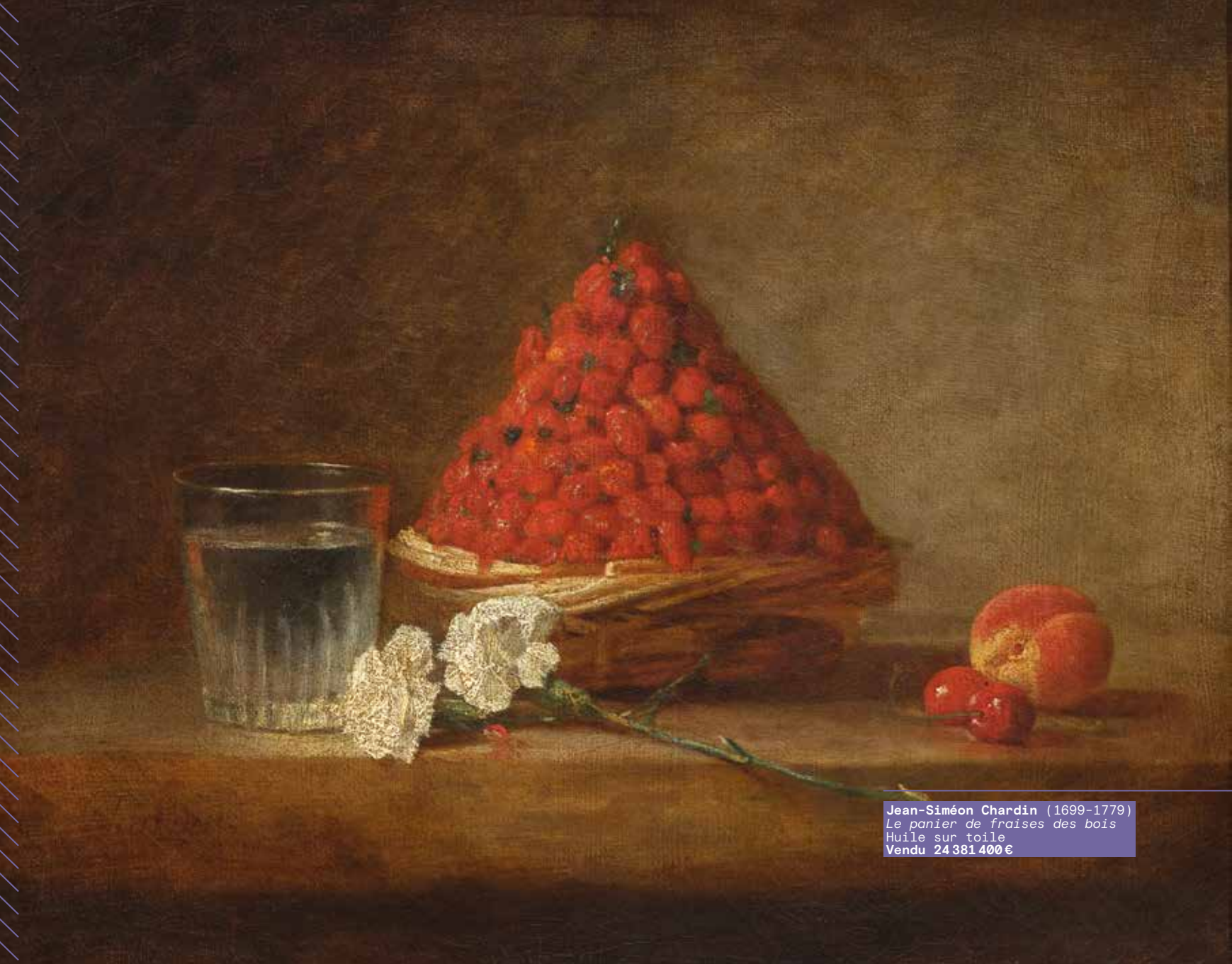
Jean-Siméon Chardin (1699-1779) Le panier de fraises des bois Huile sur toile Vendu 24 381 400 €