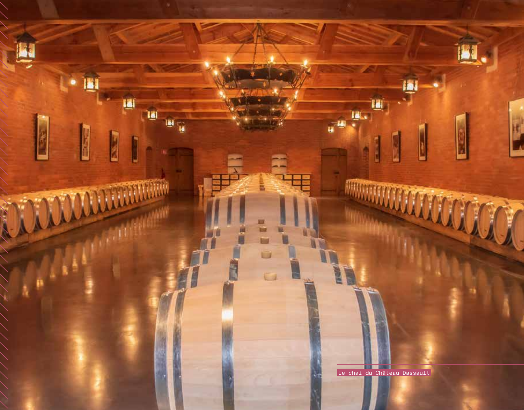
Le chai du Château Dassault