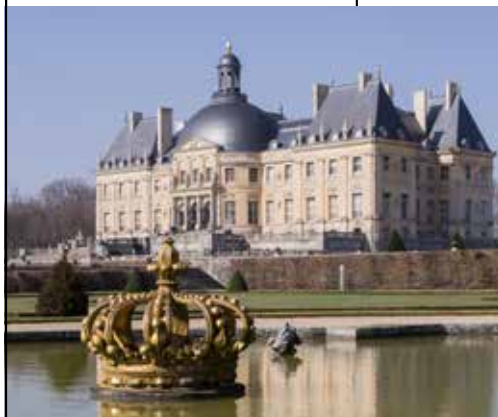
Le château de Vaux-le-Vicomte